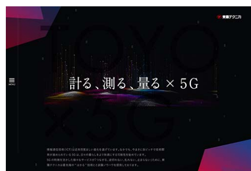
5G 計測ソリューション特設 Web サイト