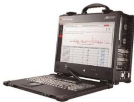
パケットキャプチャ/解析システム 「SYNESIS」