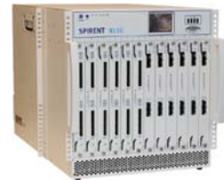
次世代ネットワーク IP パフォーマンススタ 「Spirent TestCenter」