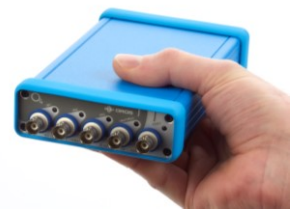
超小型 FFT アナライザ