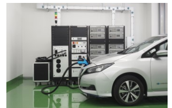
電気自動車充電評価サービス