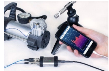
The Modal Shop 社 ICP-USB 変換モジュール「485B39」