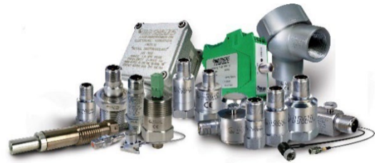
PCB Piezotronics 社 工業用振動センサー