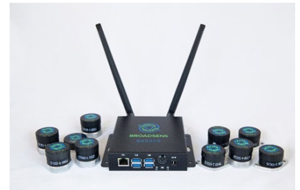
Broadsens 社 ワイヤレス振動センサー