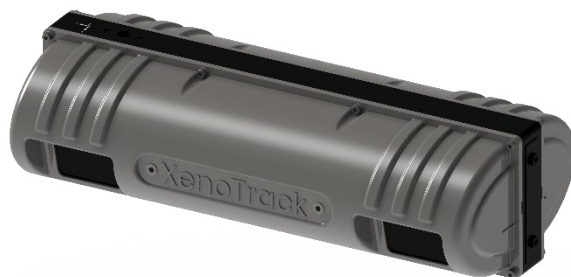
路面性状計測システム「TN-Twin Tracker」センサー本体

2022年11月24日(木)～25日(金)に開催される「ハイウェイテクノフェア 2022」のネクスコ東日本グループのブースにて本製品を初出展いたします。